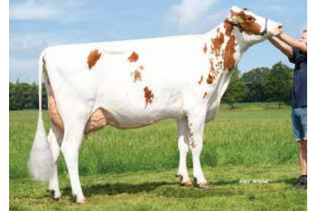
K&L SV Sunny Red

Kazein BB / A1A2 Süt Yağ Protein +1444 kg +0.10 % -0.02 % +69 kg +47 kg Güvenirlilik 78 % Kızları/ Sürü - / -